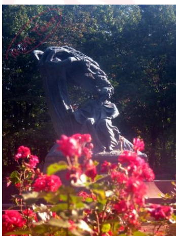
Łazienki – pomnik Chopina

W XVI w gdy w centrum zainteresowań politycznych znalazły się tereny północne i wschodnie, król Zygmunt August coraz częściej przebywał w Warszawie czyniąc ją swoją rezydencją. Oficjalnie stolicą Polski nadal był Kraków.