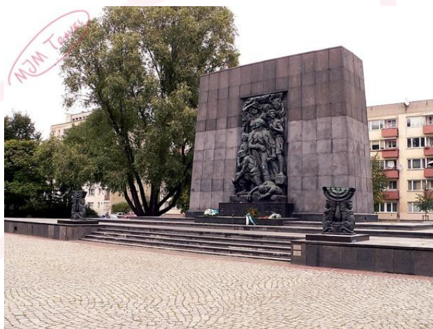
Pomnik Bohaterów Getta

1X 1939 od bombardowania przez lotnictwo niemieckie rozpoczęła się trwająca 5 lat okupacja Warszawy, która weszła w skład Generalnej Guberni. Z dużej części miasta wyodrębniono Getto Warszawskie, do którego przesiedlono ponad pół miliona Żydów. Warunki życia były tam straszne. Do połowy 1942 zmarło bądź zginęło tam ponad 100 000 Żydów. W lecie 1942 Niemcy zaczęli likwidację Getta wywożąc do Treblinki na śmierć ponad 300 000 ludności żydowskiej. 19 IV 1943 wybuchło powstanie w getcie. W czasie walk i pacyfikacji powstania Hitlerowcy zabili kilkadziesiąt tys. ludzi, a po skończonych walkach teren zajmowany przez Getto Warszawskie został zrównany z ziemią. Nie zostawiono nawet ruin budynków.