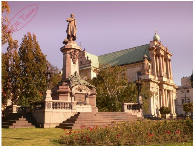
Pomnik Adama Mickiewicza

Obecnie Warszawa jest zupełnie inna od tej z przed wojny. Większość dzielnic zupełnie zmieniła swój charakter. Dość wspomnieć o tym, że przed wojną Warszawa była największym w Europie skupiskiem ludności żydowskiej, która zamieszkiwała głównie północne części miasta: Muranów, Powązki, Leszno. Dziś ślady kultury Żydów to niewielka część tego co było przed wojną: synagogi, teatry, instytuty historyczne, szkoły, żłobki. Wszystko to zostało bezpowrotnie zniszczone a ludzie wymordowani. Po wojnie do Warszawy nie tylko powracali ocaleni Warszawiacy, ale napływało też wiele osób z różnych stron kraju. To spowodowało, że miasto stało się tygłem różnych kultur i obyczajów. Widać to również w