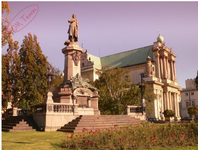
Pomnik Adama Mickiewicza

Obecnie Warszawa jest zupełnie inna od tej z przed wojny. Większość dzielnic zupełnie zmieniła swój charakter. Dość wspomnieć o tym, że przed wojną Warszawa była największym w Europie skupiskiem ludności żydowskiej, która zamieszkiwała głównie północne części miasta: Muranów, Powązki, Leszno. Dziś ślady kultury Żydów to niewielka część tego co było przed wojną: synagogi, teatry, instytuty historyczne, szkoły, żłobki. Wszystko to zostało bezpowrotnie zniszczone a ludzie wymordowani. Po wojnie do Warszawy nie tylko powracali ocaleni Warszawiacy, ale napływało też wiele osób z różnych stron kraju. To spowodowało, że miasto stało się tygłem różnych kultur i obyczajów. Widać to również w