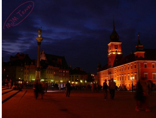
Warszawa, Plac Zamkowy

Stolica polski powstała na przełomie XIII i XIV w. Jednak pierwsze ślady osadnictwa na tym terenie pochodzą już z IX w. Do powstania Warszawy w dużej mierze przyczyniło się osłabienie Polski spowodowane rozbiciem dzielnicowym. Najazdy Litwinów na nasz Kraj spowodowały przesunięcie się nadbużańskich szlaków handlowych bardziej na południe i krzyżowanie się ich z lokalną przeprawą przez Wisłę przy wsi Solec. Dokument potwierdzający prawa lokacyjne pochodzący z 1413r świadczy o tym, że wówczas Warszawa była ważnym ośrodkiem miejskim.